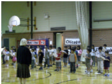
1, 2年生の合同練習 文化祭当日を お楽しみに！

中学部3年生は、双葉会英語ニュースです。今年の双葉会の最新情報とともに、最近起こったことについてもレポートしています。これもCポッドにおいて展示を行います。文化祭当日にはご家族お揃いでお越し下さい。