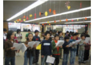
教会訪問のための練習風景