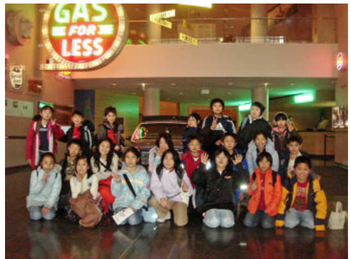
<シカゴ歴史協会にて>